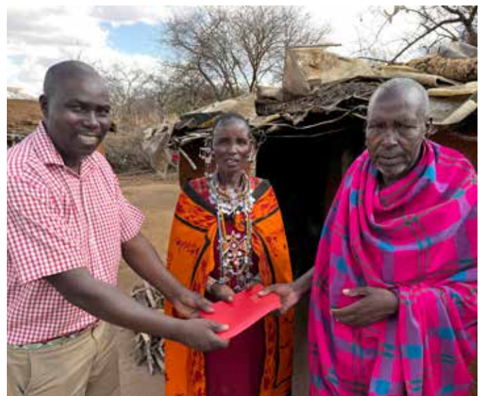
Som pastor är den bästa gåva till världen idag Guds ord.