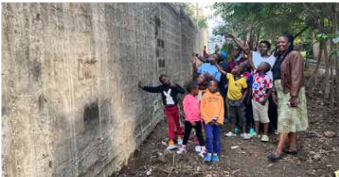
Barn och personal är tacksamma över att den sista delen av säkerhetsmuren snart är färdigbyggd.)

Efter flera år av planering har beslutet landat i att bygga en grundskola på New Life Mission. Det kommer att bli mycket spännande med möjligheter att tillgodose förskoleeleverna med en fortsatt trygg och kvalitativ utbildning ifrån årskurs 1-6.